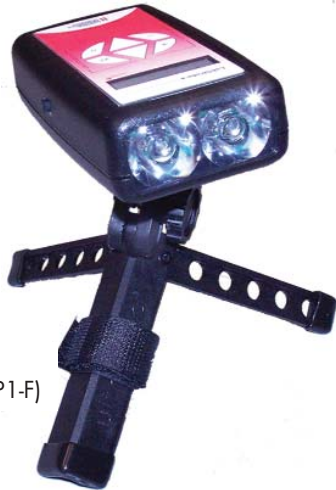
P/N STB100-F con Trípode Opcional (P/N TP1-F)

Estroboscopio Compacto Y Económico de LEDs